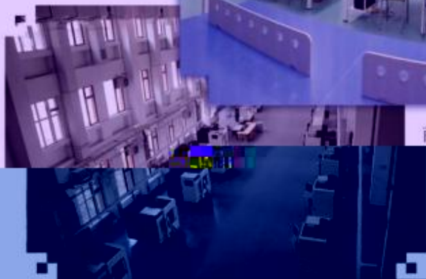
DMG 数控技术 训练场所