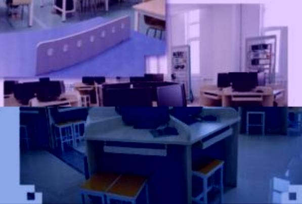
一体化课程教学设计 综合实训室